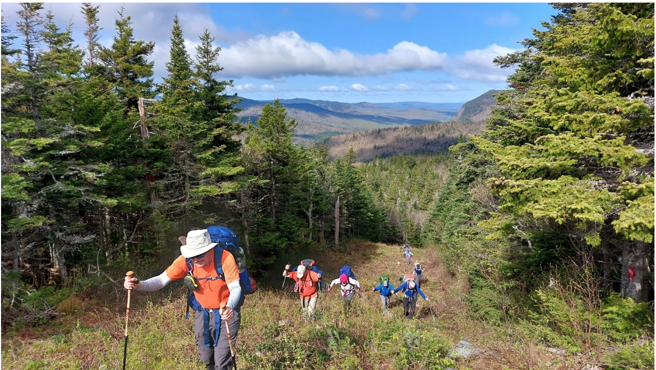
EBR 2023 : un tronçon dans la frontière, avec la montagne de Marbre en arrière-plan.

La 18 e édition de notre activité emblématique aura lieu du 14 au 20 mai prochain. Le parcours choisi cette fois-ci est de Woburn à Chartierville et, inclut une journée d'exploration dans la partie sud du secteur Gosford. L'EBR est en semi autonomie avec deux livraisons de ravitaillement, navette et équipe de soutien au besoin. Intéressé? Le document préparatoire sera disponible à la fin mars. Communiquez avec mscholz@abacom.com .