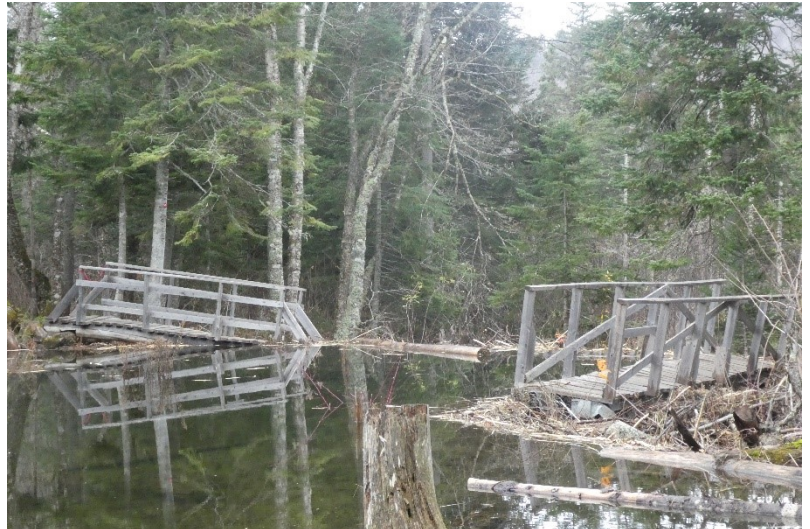
Aperçu des dégâts causés par les castors dans ce secteur.